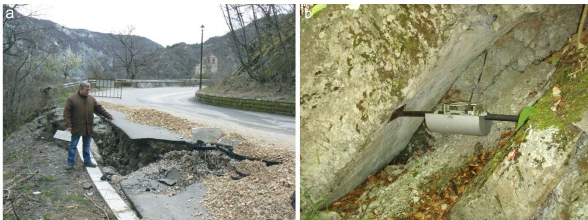
Фиг. 1: а) Теренен експертен оглед на свличане над пътя Асеновград-Смолян в района на Асеновата крепост; б) Инсталиран апарат за мониторинг на активен разлом в ЮЗ България